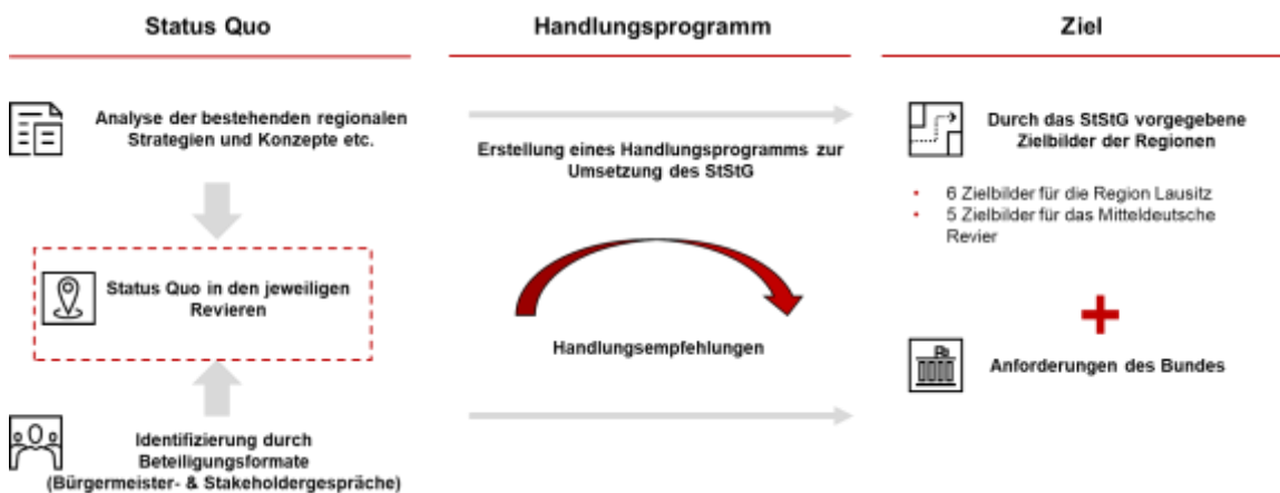
Abbildung 1: Konzeptionelle Einordnung der Handlungsempfehlungen

Die Handlungsempfehlungen, die Entwicklungspfade vom Ist- zum Zielzustand beschreiben, sind in zwei grundsätzliche Ebenen, die strategische und die revierbezogene, zu unterteilen. Zuerst sind jene übergeordneten strategischen Festlegungen zu treffen, die gemeinsam mit den individuellen Zielbildern den strategischen Unterbau der spezifischen Handlungsempfehlungen bilden. Die revierspezifischen Handlungsempfehlungen wiederum bilden die heterogene Ausgangssituation und Besonderheiten der Reviere mit individuellen Leitbildern ab.